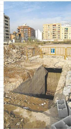
Inundación. La entrada de agua durante décadas ha dejado una capa de barro, en la imagen.

no parecen estar completado de instalación de aireación y no está nada claro que no estuvieran comunicados, pero las actuaciones posteriores a la Guerra Civil con la construcción de sucesivas balsas no nos permite valorar la posible intercomunicación apreciándose muros de cierre de encofrado más moderno. En ambos refugios hay inscripciones de diverso tipo muy borrosas y rotulados avisos pintados en las paredes de «se prohíbe fumar».